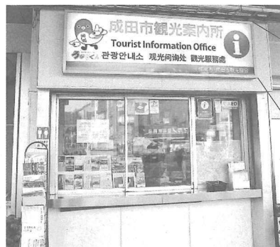
資料 9 成田市観光案内所の写真